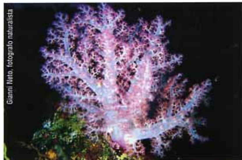
Alcionario ad albero - Dendronephthya klunzingeri Corallo coloniale che presenta uno scheletro elastico, di consistenza gommosa e con tessuti traslucidi. Raggiunge i 90 cm di altezza e può vivere fino ad oltre 100 metri di profondità. Il colore varia dal rosso all'arancio, al bianco o rosato. Questo corallo è in grado di variare la quantità d'acqua all'interno del corpo, in modo da poter espandere al massimo le braccia, o, al contrario, richiudersi quasi completamente su se stesso.

A supporto della validità del metodo di raccolta ci sono i risultati ottenuti nelle due ricerche precedenti, sempre svolte dall'Ateneo bolognese: Missione Hippocampus Mediterraneo, il censimento dei cavallucci marini svolto tra il 1999 e il 2001, che ha ricevuto l'attenzione di Conservation Biology, la rivista della Società internazionale statunitense per la Conservazione della Natura, proprio grazie al fatto che i dati sono stati raccolti da subacquei volontari e non da personale specializzato; il più recente "Sub per l'Ambiente" (2002-2005, www.progettosubambiente.org ), un monitoraggio ambientale sulla biodiversità marina mediterranea, che ha coinvolto quasi 4000 subacquei in quattro anni, ottenendo 18.757